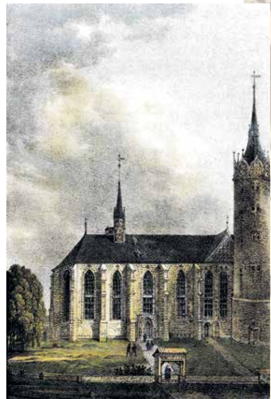
Slotkerk De Wittenberg.

Reserveren kan vanaf heden in De Vergulde Swaen, tijdens de openingsuren op woensdag/zaterdag van 10.00-16.00 uur, zondag van 14.00-17.00 uur, of telefonisch 078-612 56 81, of via telefoon/email: 078-619 16 73, klazien@odekerken.net . De kosten voor deelname bedragen € 2,50. Per lidmaatschap van de Historische Vereniging is er 1 maal gratis toegang. De lezing vangt aan om 20.00 uur en is er inloop vanaf 19.30 uur.