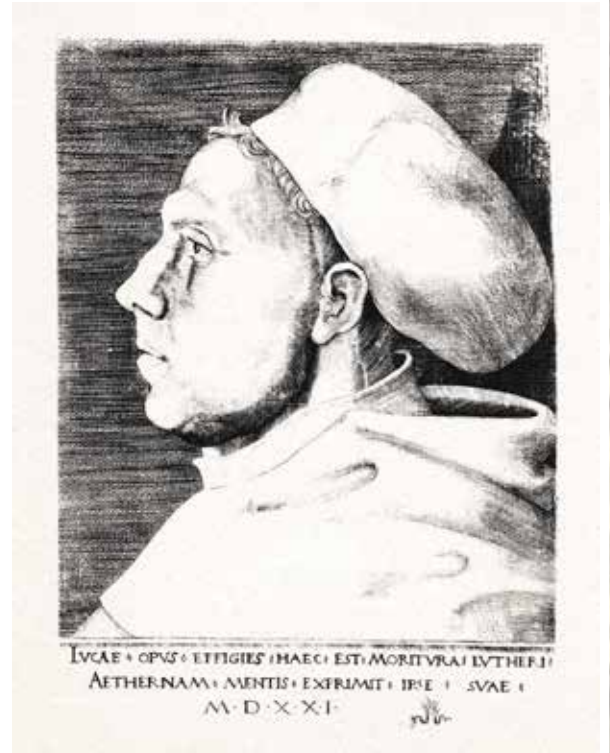
Maarten Luther als monnik.