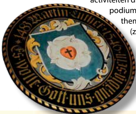
Lutherroos, het wapen van Luther.