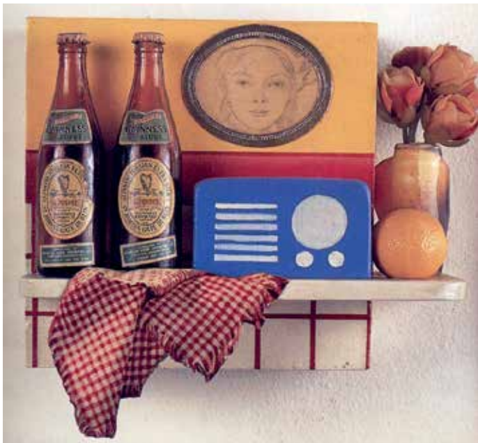
Tweede helft 20ste eeuw: Tom Wesselmann, Amerikaanse Pop-Art.

De eerste reactie van de kunst was het impressionisme. Het menselijk oog kijkt anders dan de camera. De mens geeft betekenis aan wat het ziet. De foto is objectief.