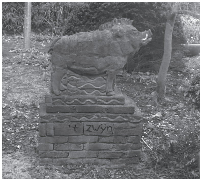
Het zwijn van Zwijndrecht.