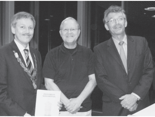
Aanbieding HVZ-schouwlijst, zomer 2009.

Al geruime tijd overweegt de gemeente Zwijndrecht een aantal objecten (bouwwerken en/of gebieden) aan te wijzen als gemeentelijk monument, naast de door het rijk aangewezen rijksmonumenten. Alhoewel de discussie over de gemeentelijke monumentenlijst reeds eerder is gestart, worden in dit eerste artikel een aantal acties vanaf 2008 tot voorjaar 2016 beschreven. Na recent overleg tussen de gemeente en de HVZ is de verwachting dat in de zomer van 2016 besluitvorming zal plaatsvinden door de gemeenteraad. Over de uiteindelijke besluitvorming en de gevolgen voor bezitters van een aangewezen monument, zal verslag worden gedaan in een tweede artikel in de volgende mededelingenkrant.