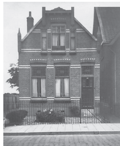
Geboortehuis aan de Rotterdamseweg