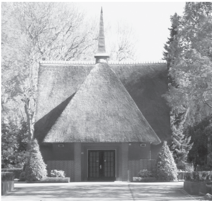
Aula begraafplaats, gebouw met de hoogste monumentale score.

Nadat het jaren stil is geweest rond het project werden er medio 2015 door verschillende raadsfracties vragen gesteld over het uitblijven van een gemeentelijk monumentenbeleid. In een reactie daarop werd door wethouder Aaike Kamsteeg de herstart en afronding van het project toegezegd. Tevens gaf de wethouder nadrukkelijk aan participatie van de HVZ daarbij belangrijk en noodzakelijk te achten. Dit leidde ertoe dat de HVZ werd gevraagd te participeren in de ambtelijke werkgroep die hiervoor verantwoordelijk is gesteld.