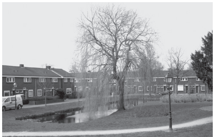
Meerdervoort, gebied met cultuurhistorische waarde.

Voorbeeld hiervan is tuindorp Meerdervoort, waarbij de waarde wordt bepaald door de ruime opzet en structuur van de wijk als geheel. De tot dusver beschouwde panden en objecten zijn allen gebouwd in de periode van 1800 tot 1945. De gemeente heeft aanvullend onderzoek gedaan naar cultuurhistorisch waardevolle objecten uit de naoorlogse architectuur. Aan daarvoor in aanmerking komende objecten is met de bekende systematiek een score toegekend en kunnen deze objecten ook aan de monumentlijst worden toegevoegd. Voorbeeld daarvan is het als SBC-gebouw (score 72) bekendstaand gebouw nabij winkelcentrum Walburg. Bij dit artikel vindt u afbeeldingen van de diverse besproken gebouwen, objecten en gebieden.