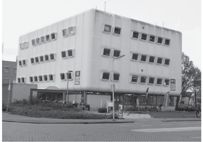
SBCgebouw als monument uit de naoorlogse architectuur.

Met 80 punten krijgt de aula bij de begraafplaats de hoogste score. De meeste als monument aan te merken gebouwen komen, zoals te verwachten, voor op de historische assen van o.a. het Veerplein, de Rotterdamseweg en de Bruinelaan. Naast gebouwen worden ook andere objecten aangemerkt als cultuurhistorisch relevant en in de scorelijst meegenomen. Voorbeeld hiervan is het pleintje met lantaarn (score 60) bij de Prins Bernhardstraat/Bruinelaan. Onze panden van De Vergulde Swaen komen uit op een score van 46 en vallen nog net binnen de grens die het Erfgoedhuis hanteert om een pand aan te merken als monument. Naast individuele gebouwen/objecten zijn ook enkele gebieden met cultuurhistorische waarde benoemd.